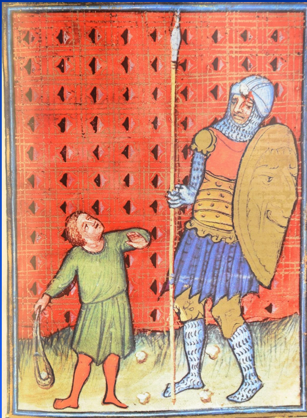
David e Goliath