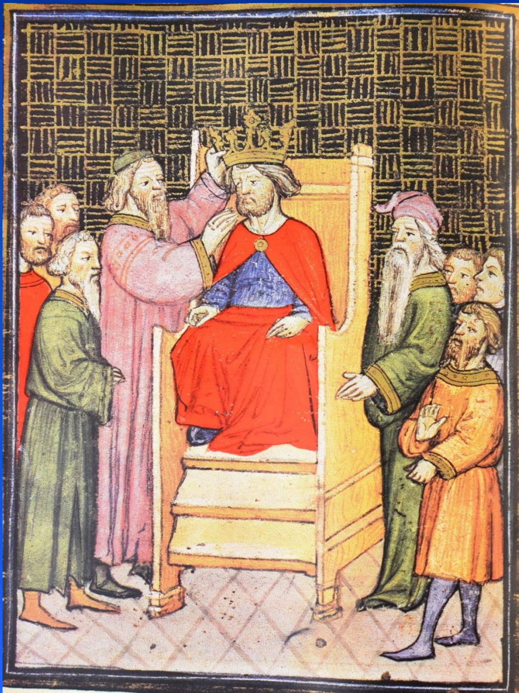
Unção de David por Samuel