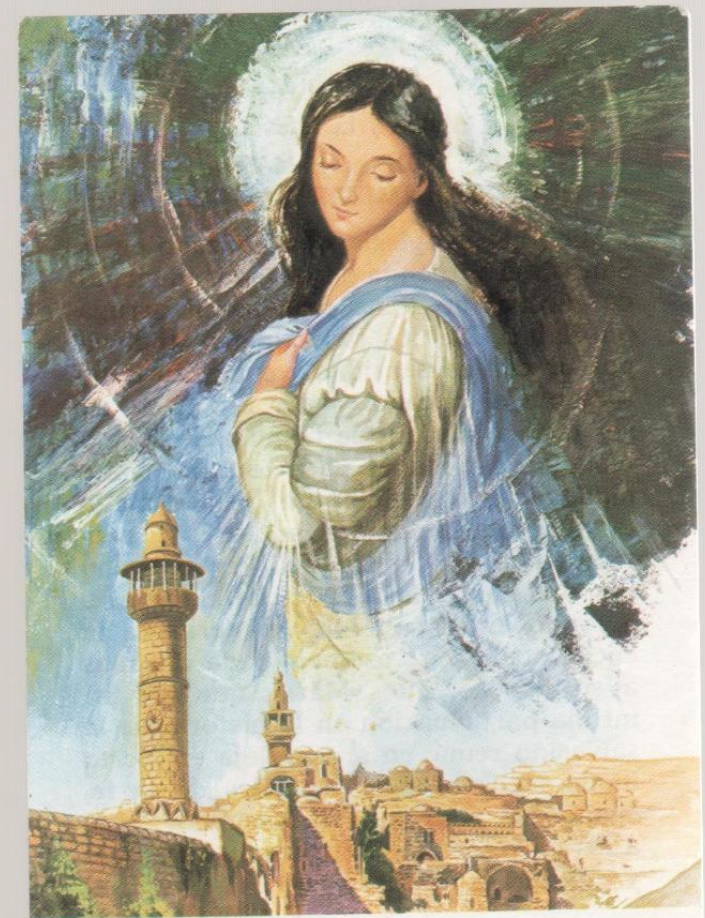
TORRE DE DAVID